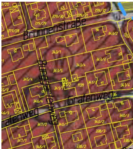
Ausschnitt FNP (ohne Maßstab)

Im aktuell rechtskräftigen Flächennutzungsplan des Gemeindeverwaltungsverbandes Teinachtal, dem die Stadt Neubulach angehört, sind die Flächen entsprechend ihrer aktuellen Nutzung als Wohnbaufläche dargestellt. Da sich die Flächennutzung nicht ändert, wird der Bebauungsplan demnach aus dem FNP entwickelt.