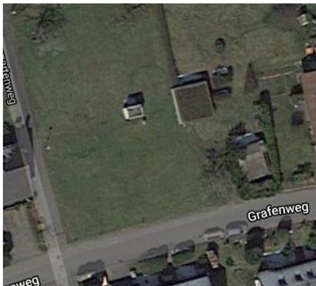
Luftbild Stand 04.12.2020