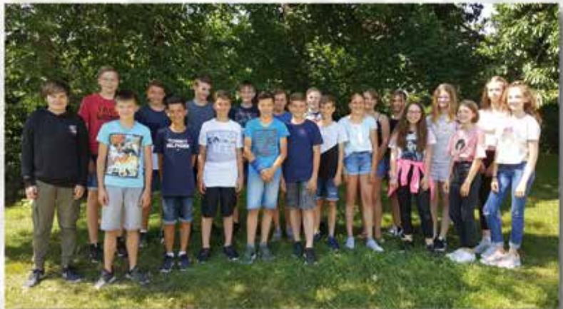
Gruppe Altbulach / Neubulach Sonntag, 18. Oktober 2020