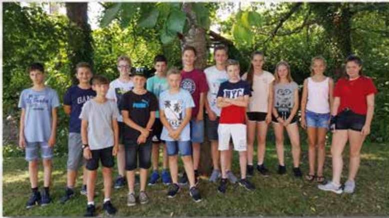
Gruppe Oberhaugstett / Liebelsberg Sonntag, 11. Oktober 2020